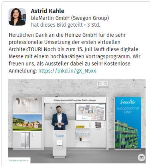
Social Media-Post der Firma bluMartin