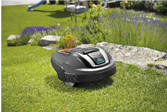
Praktischer Helfer: der Gardena Mähroboter R70Li inkl. Diebstahlschutz, zu gewinnen beim Ostergewinnspiel von bauemotion.de

Wem die Zeit für regelmäßiges Mähen fehlt, der kann auch einem Mähroboter diese Aufgabe übertragen. Einen dieser flinken kleinen Helfer im Wert von 1.275 Euro verlost dieses Jahr bauemotion.de zu Ostern. Einmal installiert, haben Besitzer mit der Rasenpflege praktisch nichts mehr zu tun. Das Gewinnspiel läuft noch bis zum 2. April 2018 – teilnehmen kann jeder ab 18 Jahren kostenlos unter www.bauemotion.de/ostern