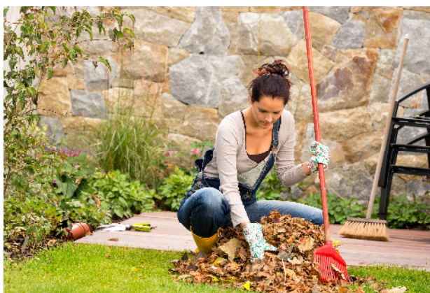
So schön das bunte Laub im Herbst an den Bäumen leuchtet – spätestens wenn die Pracht zu Boden rieselt, bedeutet es für den Gartenbesitzer vor allem eins: Arbeit.

Oft versinkt der Garten im Herbst regelrecht im Laub. Bei den Pflanzflächen kommt es darauf an, wie viel Laub dort liegt. Pflanzen ersticken unter einer zu dicken Schicht, während bei Gehölzen über den Winter Fäulnisstellen entstehen. Ein bisschen Laub ist aber kein Problem, es bildet zugleich eine gute Mulchschicht für den Winter. Vom Rasen muss das Laub allerdings entfernt werden, da es nun auch Zeit für die Herbstdüngung ist. Hierfür wird ein kalibetonter Dünger verwendet, der das Gras frostbeständiger macht.