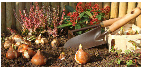
Jetzt ist der ideale Zeitpunkt, um im Garten Blumenzwiebeln fürs Frühjahr zu setzen.

Ab Mitte Oktober kann im Prinzip fast alles gepflanzt werden. Bei wurzelnackten Pflanzen, wie etwa Obstbäumen und Rosen, sollte auf den Laubfall gewartet werden.