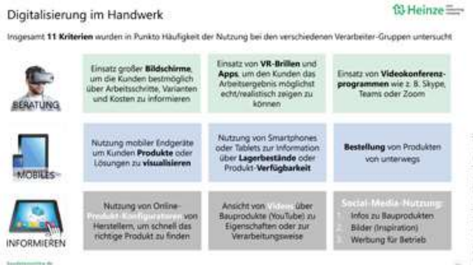
Abbildung: Heinze GmbH

oder Produkt-Verfügbarkeiten abzufragen, Produkte von unterwegs zu bestellen oder Social-Media-Kanäle zur Vermarktung des eigenen Betriebs zu nutzen. Auch der Einsatz von Videokonferenzprogrammen, großen Bildschirmen sowie VR-Brillen und Apps zur Kundeninformation wurde analysiert. Die Ergebnisse wurden auch hier für jede einzelne Verarbeiter-Gruppe ausgewertet und in der Studie dokumentiert.